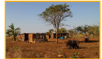
Dorf nahe Namaacha