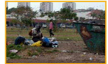
Müllsammler in Maputo